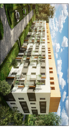
Budynnek przy ul. Chopina w Łomiankach