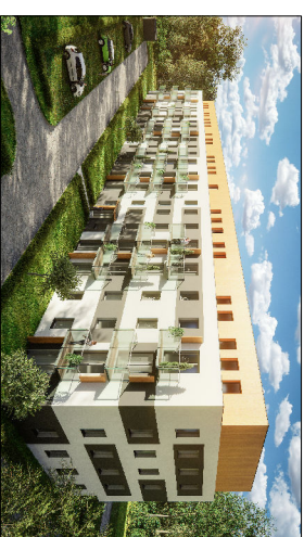
Budynek przy ul. Chopina w Łomiankach