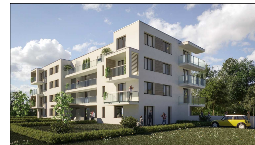
Budynek przy ul. 36 P.P. Legii Akademickiej w Parzniewie

UWAGA: Powierzchnie liczone wg. normy PN-ISO 9836:1997. Rysunek na podstawie projektu budowlanego. Możliwe jest wystąpienie niewielkich zmian w projekcie wykonawczym. Wyposażenie: meble, biały montaż, drzwi wewnętrzne przedstawiają jedynie przykładową aranżację i nie stanowią wyposażenia lokalu.