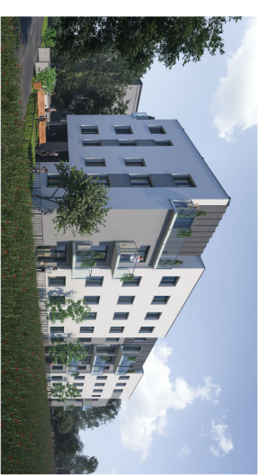
Budynek przy ul. Piasta 2 w Piastowie

Wyposażenie: meble, biały montaż, drzwi wewnętrzne przedstawiają jedynie przykładową aranżację i nie stanowią wyposażenia lokalu.