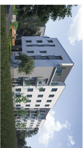
Budynek przy ul. Piasta 2 w Piastowie

UWAGA: Powierzchnie liczone wg. normy PN-ISO 9836:1997. Rysunek na podstawie projektu budowlanego. Możliwe jest wystąpienie niewielkich zmian w projekcie wykonawczym. Wyposażenie: meble, biały montaż, drzwi wewnętrzne przedstawiają jedynie przykładową aranżację i nie stanowią wyposażenia lokalu.