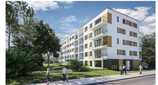
Budynek przy ul. Andriollego w Otwocku.

UWAGA: Powierzchnie liczone wg. normy PN-ISO 9836:1997. Rysunek na podstawie projektu budowlanego. Możliwe jest wystąpienie niewielkich zmian w projekcie wykonawczym.