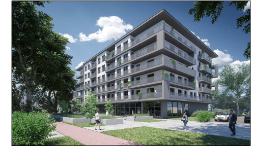
Budynek przy ulicy Puławskiej 27 w Piasecznie