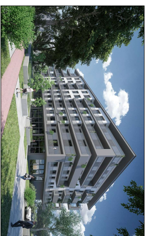
Budynek przy ulicy Puławskiej 27 w Piasecznie